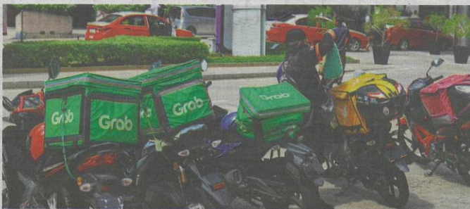
Penambahbaikan Akta 800 perlu bagi memberi manfaat kepada pekerja gig serta pekerja sektor tidak formal (Foto hiasan)

"Tempoh bayaran dan kadar gantian harus cukup untuk memberi 'buffer' kepada pekerja mencari pekerjaan baharu tanpa tekanan kewangan melampau.